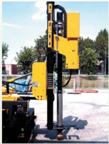
MARTELLI FONDO FORO