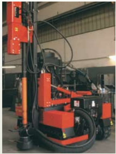
MARTILLO DE BASE HUECA